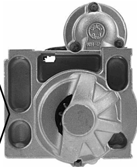
▲ Late Version ■ Version récente ■ Versión posterior

Design Change Modification de Conceptio Cambio de diseño